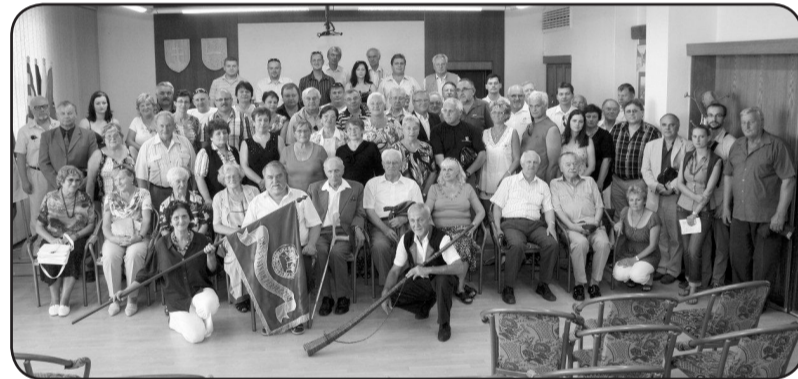
Členovia Spolku priateľov Turzovky – účastníci VČS 13.8.2010